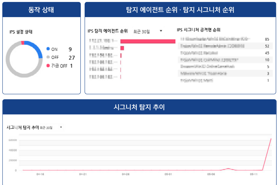
▲ AhnLab CPP 대시보드(Host IPS)